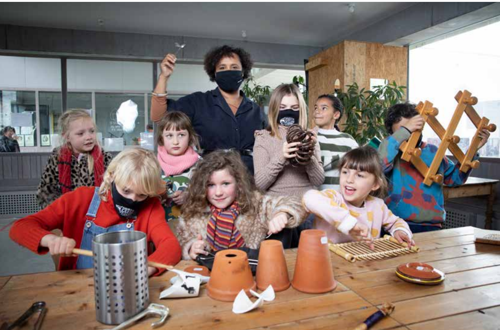
Muziek maken met voorwerpen uit de kringwinkel tijdens workshop Mais Quelle Chanson.