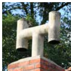
Schouwstukken of verluchtingsbuizen