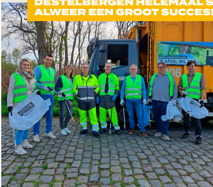
Ook het schepencollege van Destelbergen hielp mee zwerfvuil verzamelen.

Op zondag 23 april werd de opruimweek van de Gentsche Gruute Kuis en Destelbergen Helemaal Schoon op een wervelende manier afgesloten. Een Bulgaarse band verwelkomde vanaf 9 uur de vroege vogels op het Heirnisplein. Tot 11u30 ruimden IVAGO-medewerkers de straten rond de Dampoort op, samen met familie, vrienden en buurtbewoners. Daarna blies Gene de IVAGO-rapper iedereen van zijn sokken, samen met zijn rapperscollectief. Kinderen en jongeren konden zich uitleven tijdens een graffitiworkshop. Kortom, een mooie dag en een groot succes: liefst 4.569 vrijwilligers hielpen dit keer mee om de straten en pleinen van onze stad proper te maken. Bedankt aan iedereen om erbij te zijn en/of om vanop afstand voor ons te supporteren!